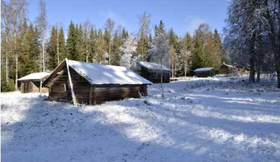
Närmast i bilden syns ett ålderdomligt timrat fäjs på fastigheten Rältlindor 7:14. Timrade fäjs av hög ålder är idag ovanliga och återfinns i huvudsak på fäbodställen.