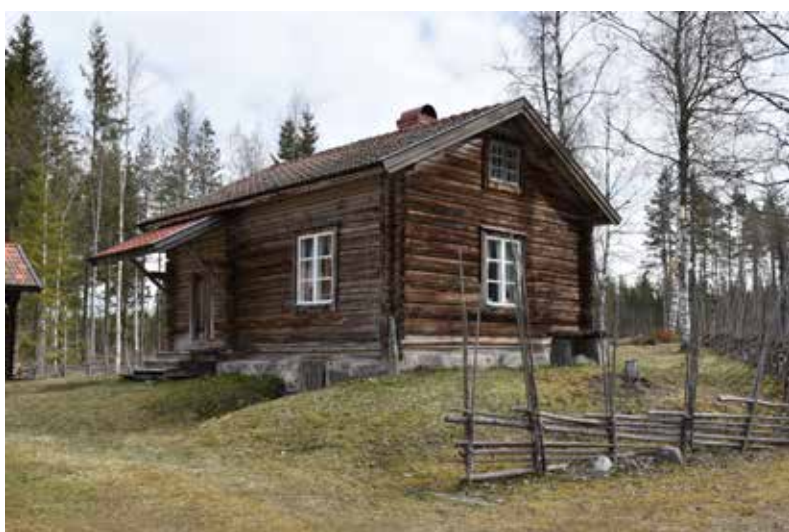
Välbevarad enkelstuga med stensatt källare och skärmtak. Hjortnäs 13:10.