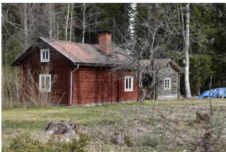
Rödfärgad enkel- eller sidokammarstuga. Fönstren har bytts under 1900-talets senare hälft och har försatts med enkla rektangulära blyspröjsar. Hjortnäs 14:9.