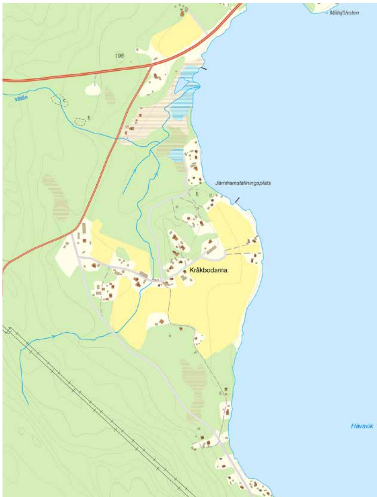
Kråkbodarna är belägna vid sjön Molnbyggen i södra delen av Leksand. Den äldre bebyggelsen är i huvudsak grupperad kring byvägen norr om odlingsmarken. I övrigt finns många nyare inslag i form av fritidshus och småhus.