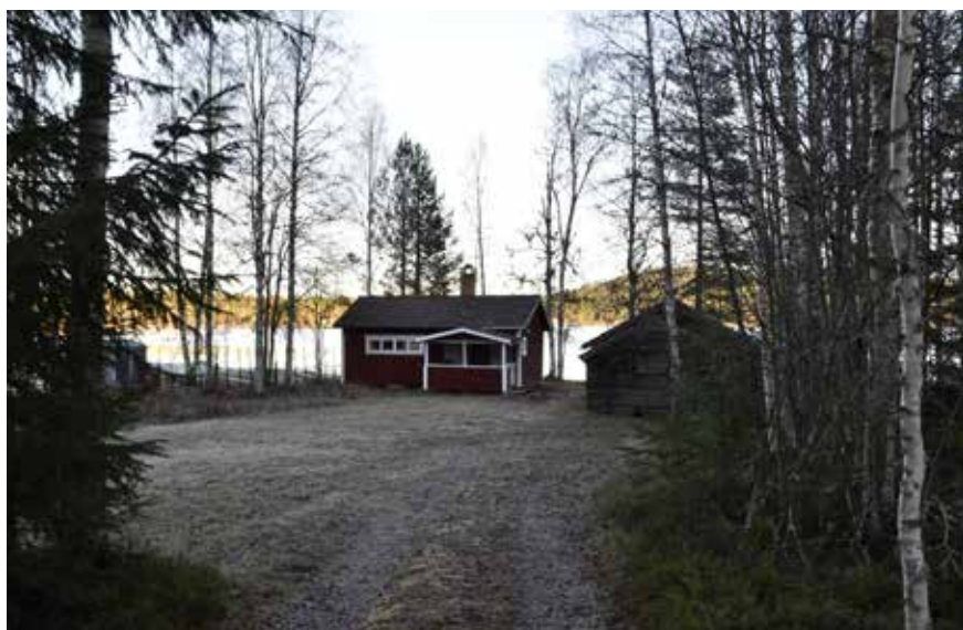
Till höger, fritidshus vid Molnbyggens strand. På samma tomt finns flera äldre timmerhus bevarade. Yttermo 33:9.