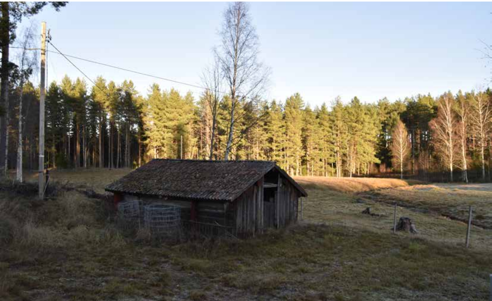
Bevarat äldre fäjs eller möjligen en gammal torkbastu invid odlingslandskapet i den västra delen av byn. Byggnaden är av ett ålderdomligt slag och kan berätta om timmerhuskulturen i äldre tider. Yttermo 33:36.