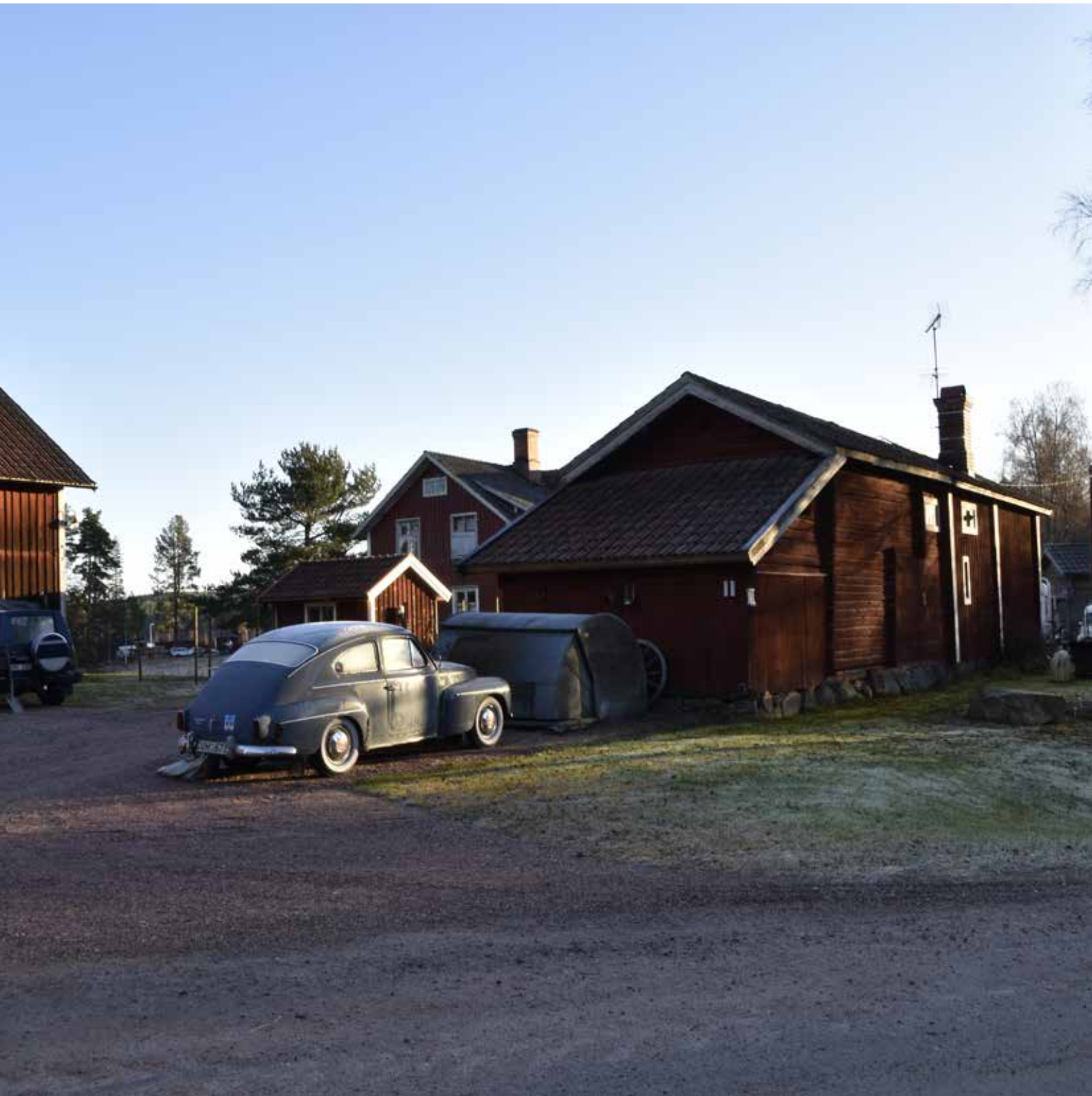
Kringbyggd gård med sen 1800-talskaraktär i den västra delen av byn. Närmast i bilden syns dock en bevarad äldre länga med källarstuga och stall med portlider. Yttermo 33:37.