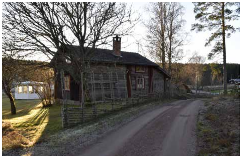
Ålderdomlig grånad enkelstuga på fastigheten Yttermo 33:24. Byggnaden är det bäst bevarade äldre bostadshuset i Kräkbodarna och kan ha uppförts som fäbodstuga.