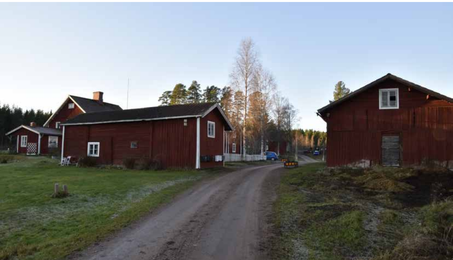
Den glest fyrkantsbyggda gård som finns på fastigheten Yttermo 33:36. Gården uppvisar flera spår av det sena 1800-talets förändringsvåg, men har trots detta bibehållit sin ursprungliga fyrkantsform samt flera äldre timmerhus.

Kringbyggd gård med ålderdomliga timmerhus. längst upp från vänster: hölada, parstuga (bostadshus), långsideshärbre, källarstuga, loftbyggnad med portlider, vagnsbod sammanbyggd med kortsideshärbre, tröskloge, brunn, stall, torkhus, smedja, lada och fähus med portlider och dyngstad.