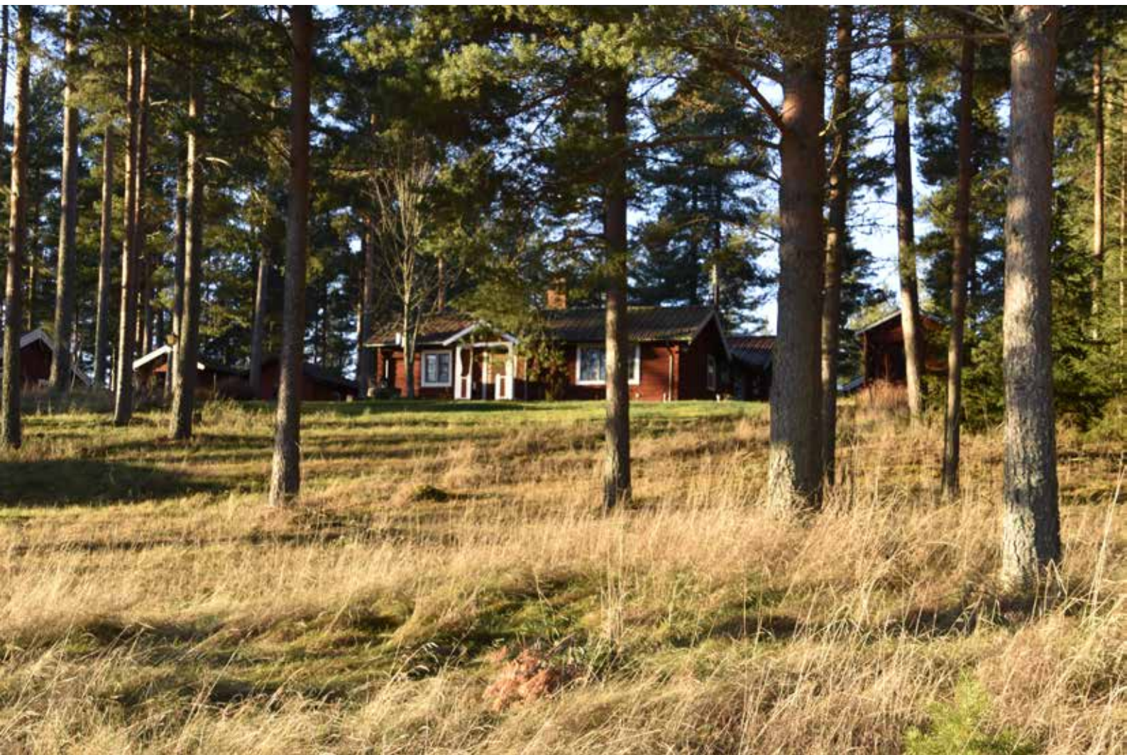
Ovan, väl anpassad modernistisk timmervilla på fastigheten Yttermo 33:27.