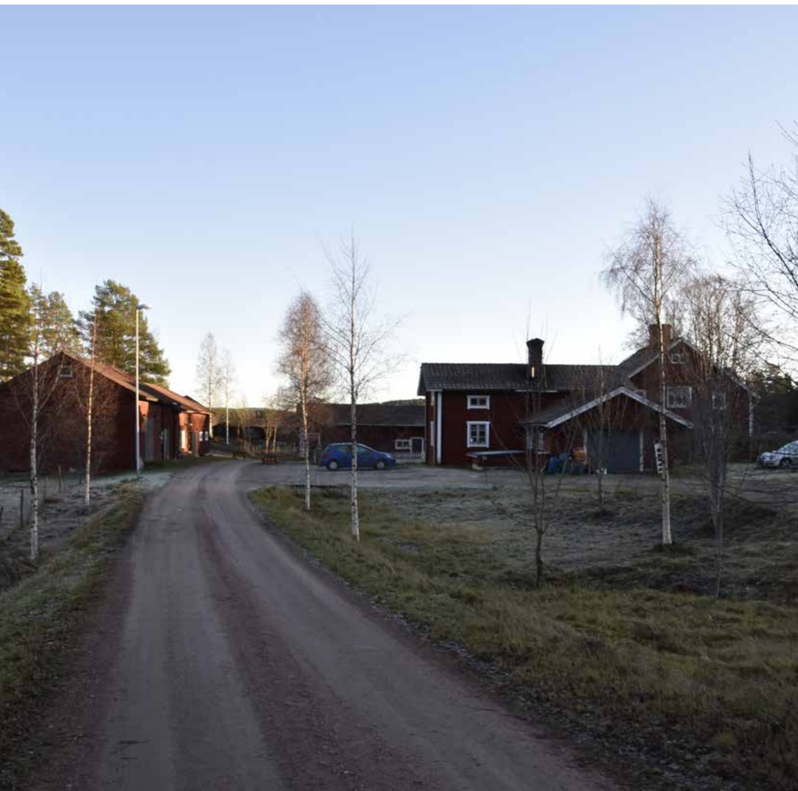
Glest fyrkantsbyggd gård vid bygatan mitt i Kråkbodarna. Gården har omdanats till följd av det sena 1800-talets förändringsvåg, men kvarstår trots detta till sin äldre struktur med fyrkantsform och flera bevarade timmerhus i landskapet runtomkring. Yttermo 33:36.