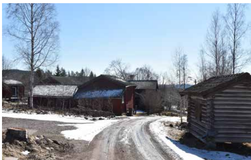
I byn finns också många äldre timmerhus som fortfarande står kvar på ålderdomliga placeringar. Längsideshärbrén, som det till höger i bilden, stod exempelvis enligt tradition utanför gårdsfyrkanten för att skyddas vid eventuell brand. Hästberg 2:28 och Hästberg 2:11.