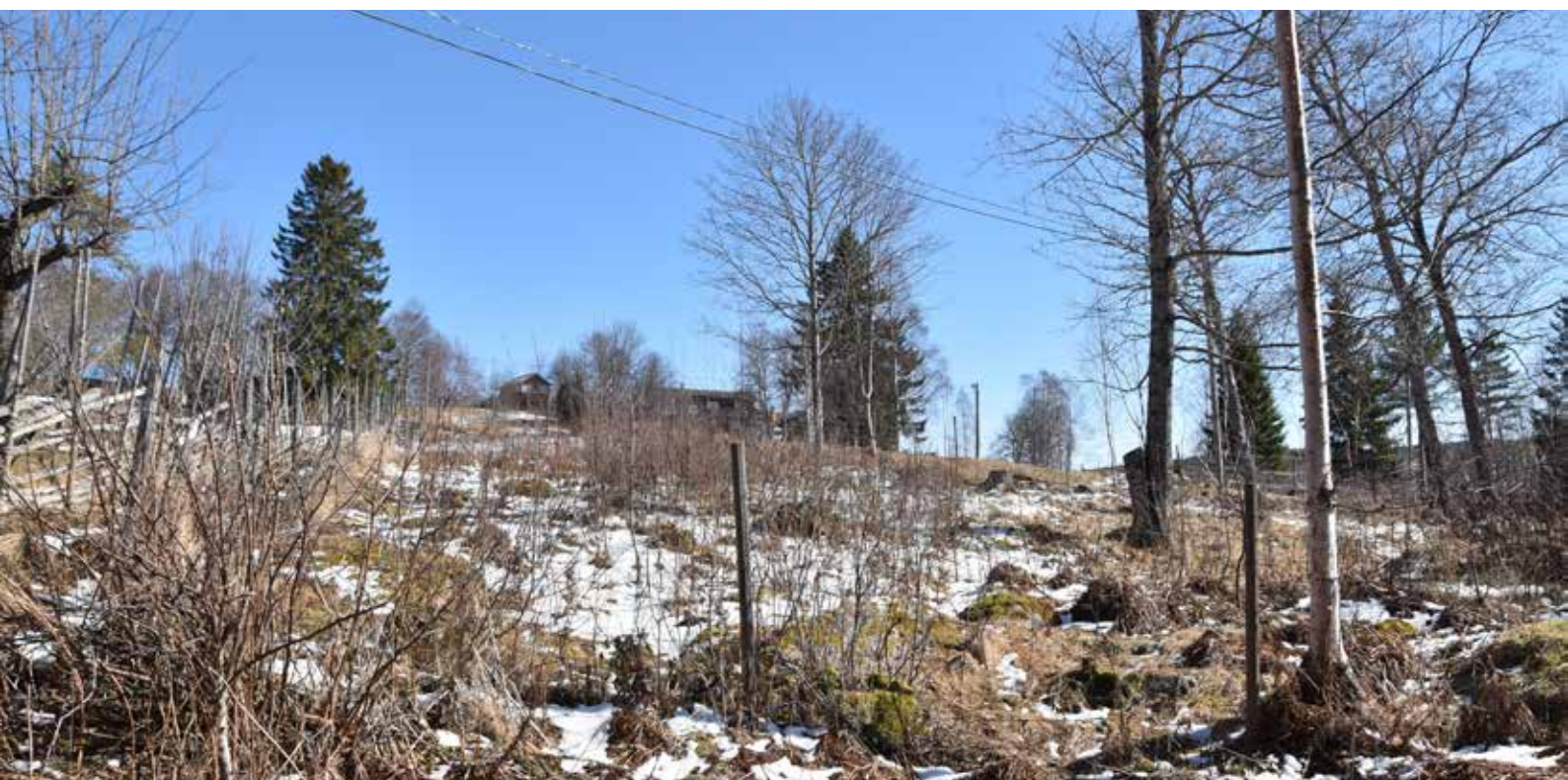
Den genombrutna, men ändå öppna jordbruksmarken är karaktäristisk för byn och bistår husen med en viktig kontext.