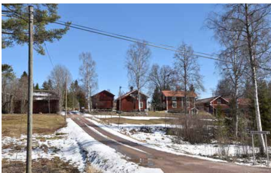
Hästberg ligger i en sluttning och flera av gårdarna har markerade lägen på åsar och höjder. Hästberg 5:5.