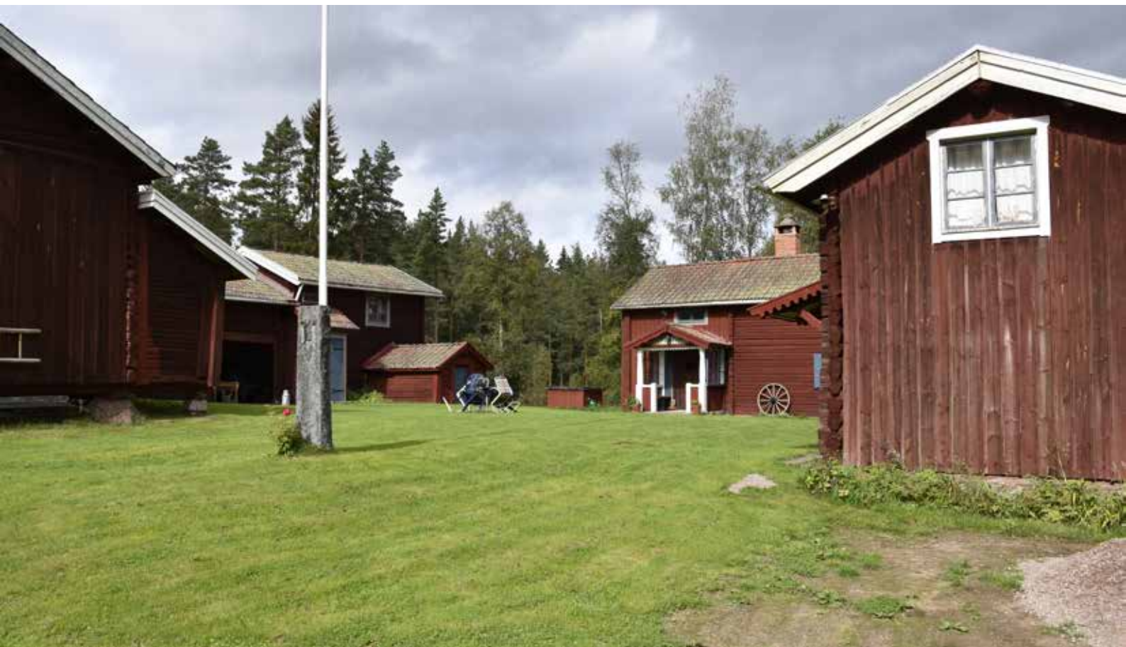
Kringbyggd gård i västra delen av Hästberg. Gården har delvis omdanats under 1900-talet, men har samtidigt bibehållit sina stora kulturhistoriska kvaliteter. Gården bedöms ha särskilt kulturvärde. Ytermo 30:33.