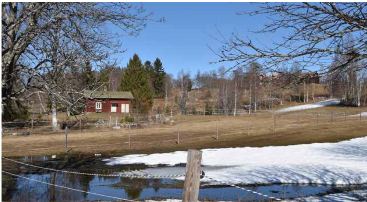
Det öppna, genombrutna jordbrukslandskapet på åsryggens västsluttning. På höjden till höger i bild syns Tillasgården. Yttermo 43:15.