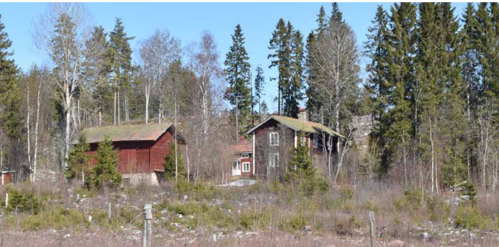
I byn finns fortfarande ett antal äldre välbevarade bostadshus. Var varsam med bostadshus som har många ålderdomliga detaljer, exempelvis tegeltak, träfönster och äldre skorstenar. Anbodarna 1:2.