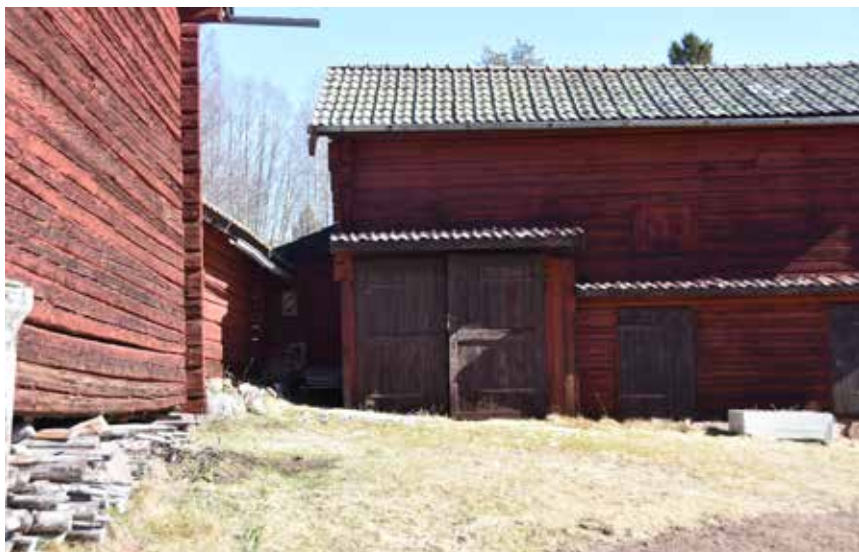
Äldre timmerhus på sidorna av en tidigare kringbyggd gård. Hästberg 2:28.