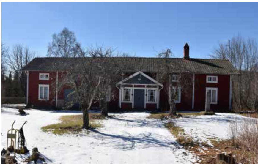
På 1800-talet påbyggdes vissa hus i Leksand till långa, sammanhållna längor med bostadshus och ekonomibyggnader. Hästberg 1:5.

Mot 1800-talets slut blev det även vanligt med sidokammarstugor (t.v) och korsplanshus (t.h). Vissa av de nya husen kom att utsmyckas med snidade fönsteröverstycken och farstukvistar med enkla lövsågade detaljer. Hästberg 5:5.