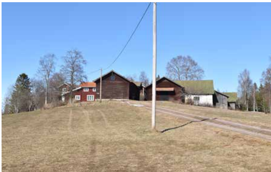
Tillasgårdens karaktäristiska placering på en höjd i jordbrukslandskapet. Gytret av byggnader är typiskt för Dalarnas byar. Hästberg 6:5.