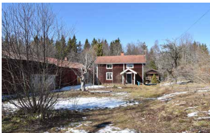
Vissa äldre hus moderniserades med nya farstukvistar, dörrar och fönster i början av 1900-talet. Hästberg 9:3.