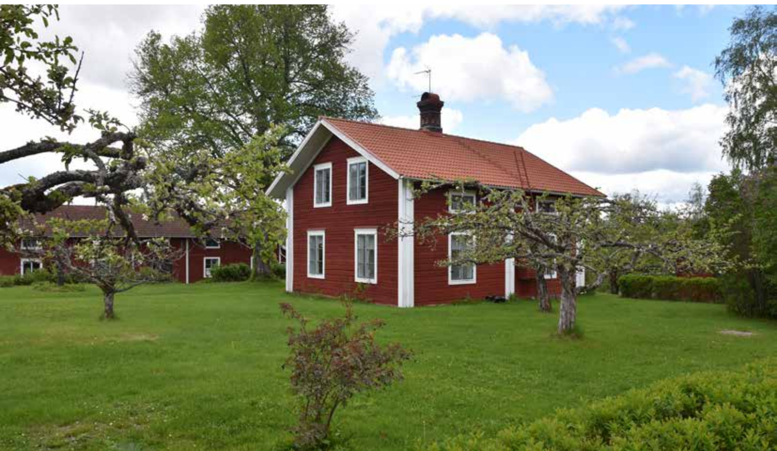
Korsplanshus på fastigheten Hästberg 5:5. Byggnaden återspeglar hur gårdarna kom att förändras från och med industrisamhällets inträde kring 1870 och bedöms därför ha särskilt kulturvärde.