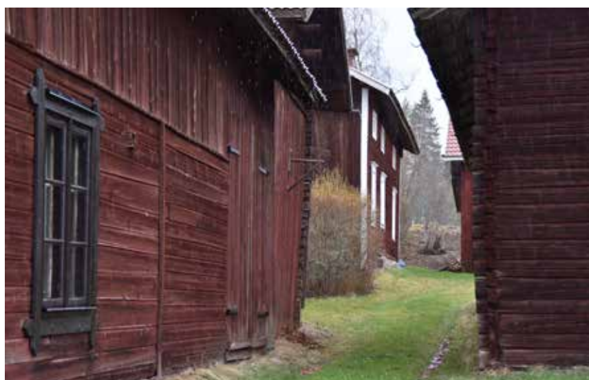
Timmerhus på Tillasgården i den östra delen av byn. De tätt placerade trä- och timmerhusen skapar en karaktär som är typisk för Leksand och övre Dalarna. Hästberg 6:5 och Hästberg 6:6.