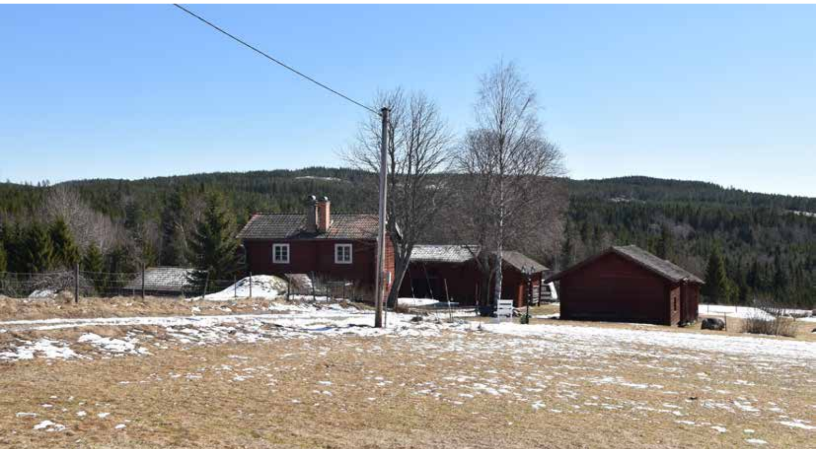
Vissa äldre gårdar är fortfarande nästan fyrkantsbyggda, ett ovanligt karaktärsdrag. Gården på bilden har intakt månghus-system och är till stort oförändrad sedan åtminstone 1800-talets senare hälft. Gården bedöms därför ha särskilt kulturvärde. Hästberg 3:4.