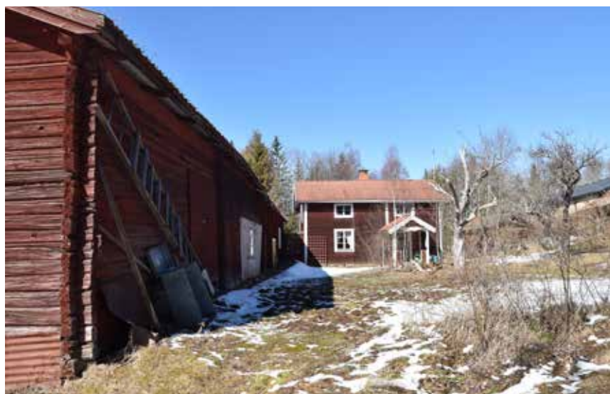
Vissa gårdar har under 1800-talet urglesats, och månghussystemets olika byggnader koncentrerats till en länga med större byggnader. Hästberg 9:3.