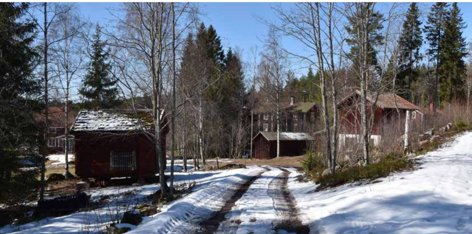
Norr om byn ligger Anbodarna, som förr var fåbodar. Parstugan som syns i mitten av bilden står på en fastighet med beteckningen Anbodarna. Anbodarna 1:2.