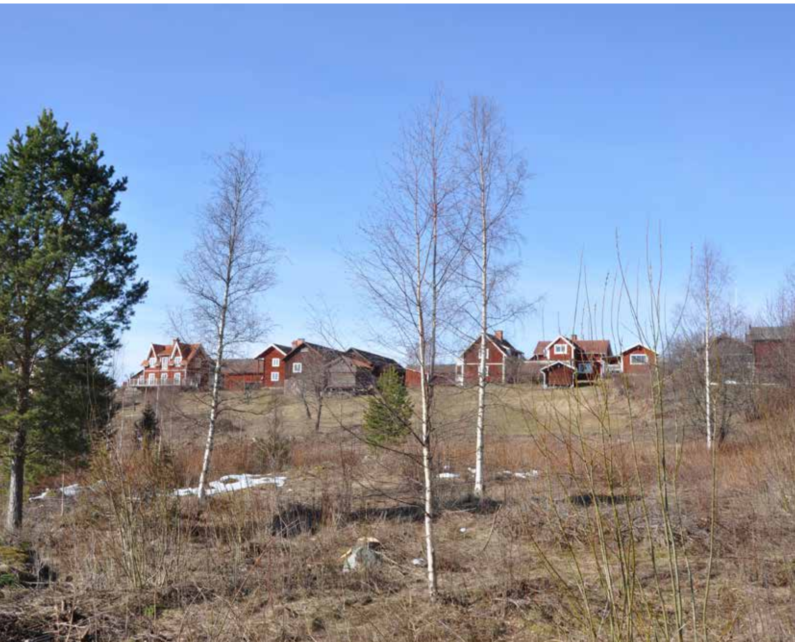
Den norra byklungan ligger på en höjd i odlingslandskapet. Vy från öster, där delar av den äldre odlingsmarken nyligen ianspråktagits för villabebyggelse.