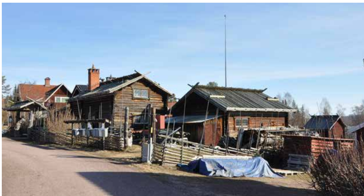
Krismansgården, en välbevarad nationalromantisk gård med många fina detaljer i norra byklungan. Husen har ålderdomliga detaljer så som nävertak med klövtäckning och blyspröjsade fönster. Gården tillkom dock sannolikt i sitt nuvarande utseende kring sekelskiftet år 1900. Hjulbäck 139:1.