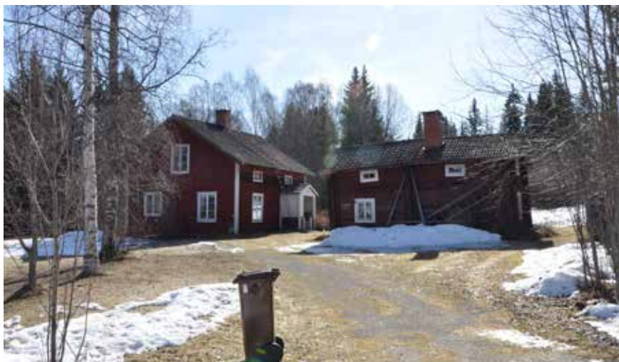
Kringbyggd gård med äldre korsplanshus och enkelstuga i södra byklungan. Hjulbäck 54:I.