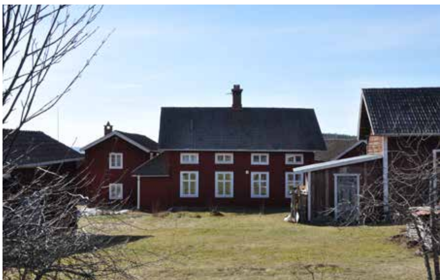
Husen står tätt placerade och bildar kringbyggdhet. Korsplanshuset i bildens mitt är placerat på gård som är kringbyggd på tre sidor. Hjulbäck 69:3.