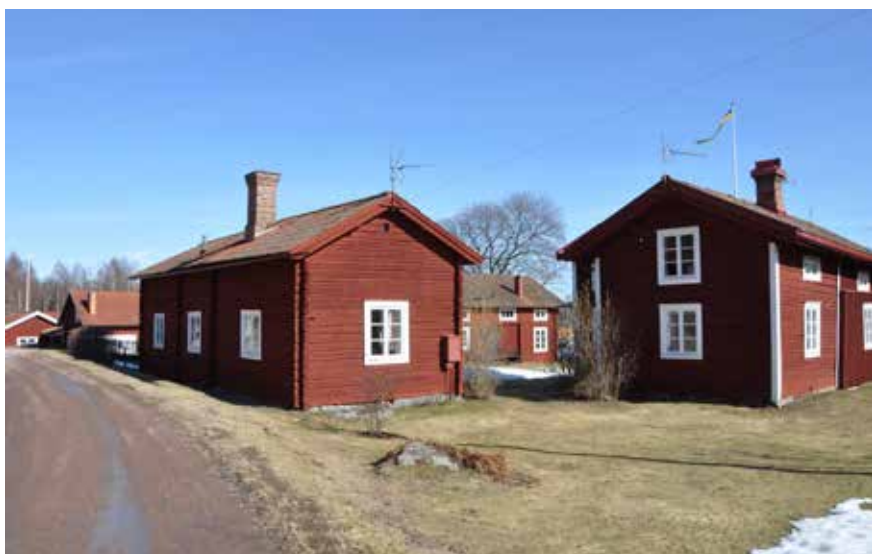
Kringbyggd gård med sidokammarstuga till vänster, bagarstuga till höger och portluder i bakgrunden. På gården finns även ett korsplanshus. Hjulbäck 94:2.