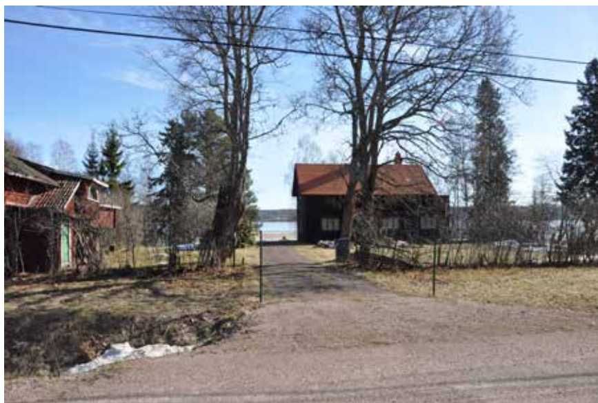
Nationalromantiskt hus och ombyggt portlider/loftbod till vänster i bilden. Fritidsbusbebyggelse från tidigt 1900-tal vid Östervikens strand. Fornby 166:I.