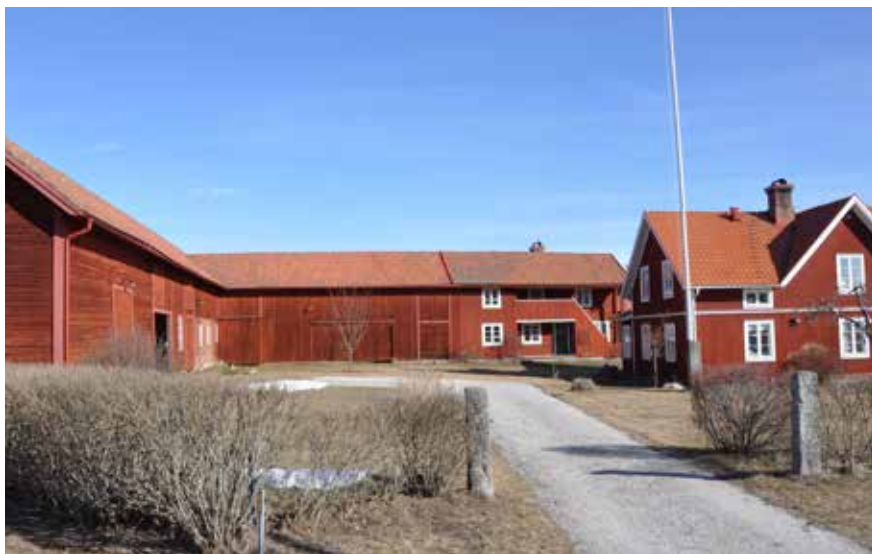
Gård från tidigt 1900-tal med kringbyggd karaktär i norra byklungan. Så som den mesta andra bebyggelsen i norra byklungan är den enhetligt faluröd. Hjulbäck 82:1.