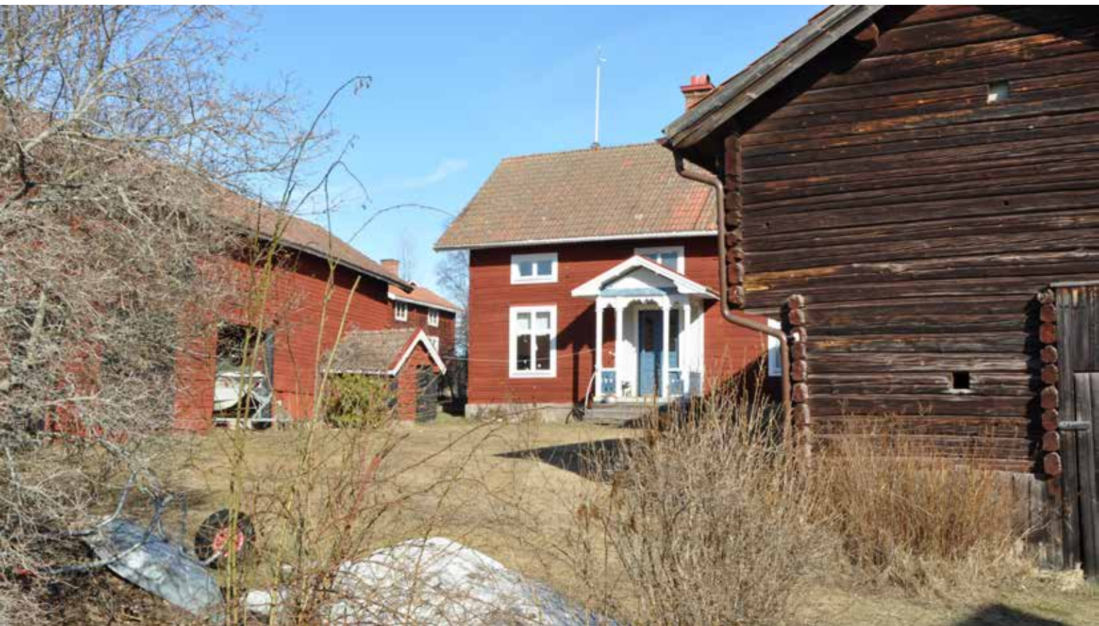
Kringbyggd gård med stort korsplanshus i norra byklungan. Byggnadstypen är typisk för det sena 1800-talet. I bakgrunden, mellan husen, syns en äldre enkelstuga vid majstångsplatsen. Hjulbäck 69:3.