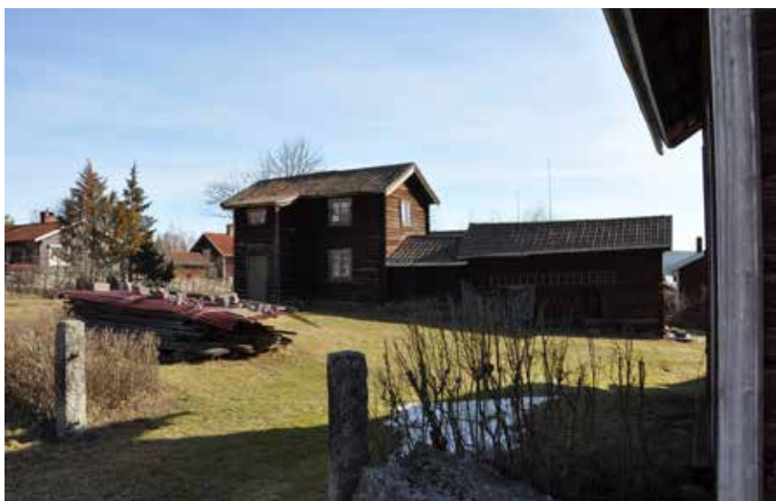
Mycket ålderdomlig enkelstuga sammanbyggd med portlider och långsideshärbre. Miljön är i sin helhet mycket värdefull eftersom den verkar närmast orörd sedan 1800-talet. Hjulbäck 58:1.