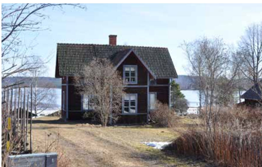
Sidokammarstuga insprängd mellan nyare villabebyggelse mellan byklungorna. Hjulbäck 131:I.