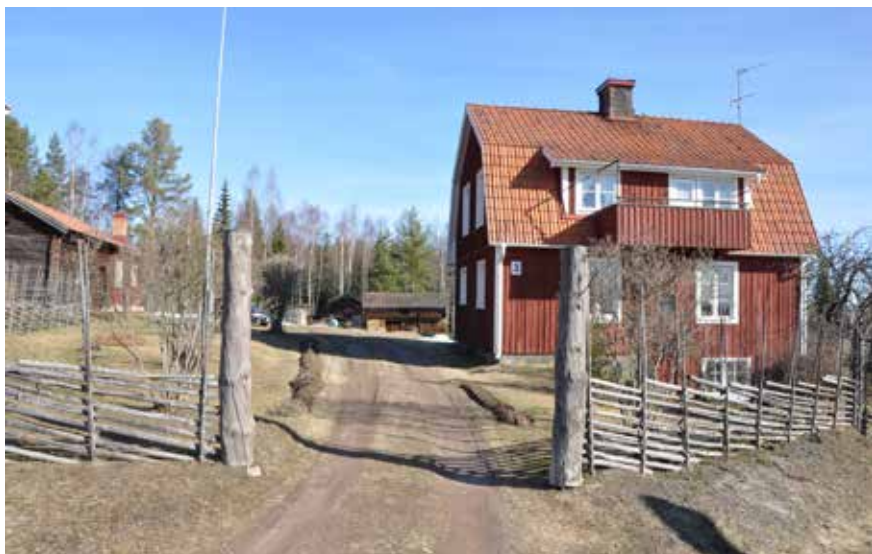
Hus med brutet sadeltak (mansardtak) i norra byklungan. Taktypen förekommer på bostadshus vid flera gårdar i norra byklungan. Hjulbäck 71:1.