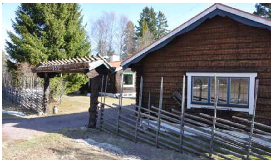
Modernistisk timmervilla söder om byn, vid Östervikens strand. Närmast i bilden syns ett garage, villan i bakgrunden. Den karaktäristiska stockportalen är vanligt förekommande i anslutning till liknande villor. Fornby 147:I.