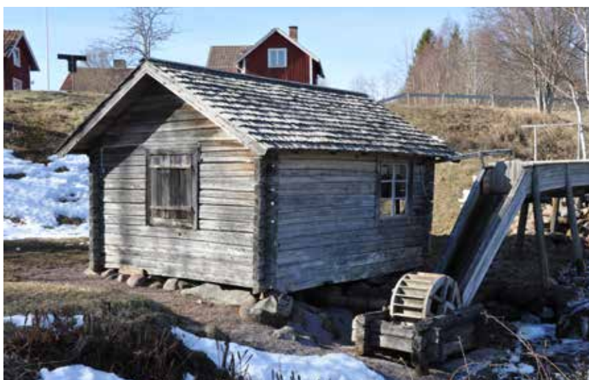
Svarvstuga med vattenkonst, en mycket värdefull byggnad med anknytning till en viktig bisyssla i Hjulbäcks historia, och platsnamnet Hjulbäck. Björken 200:I.