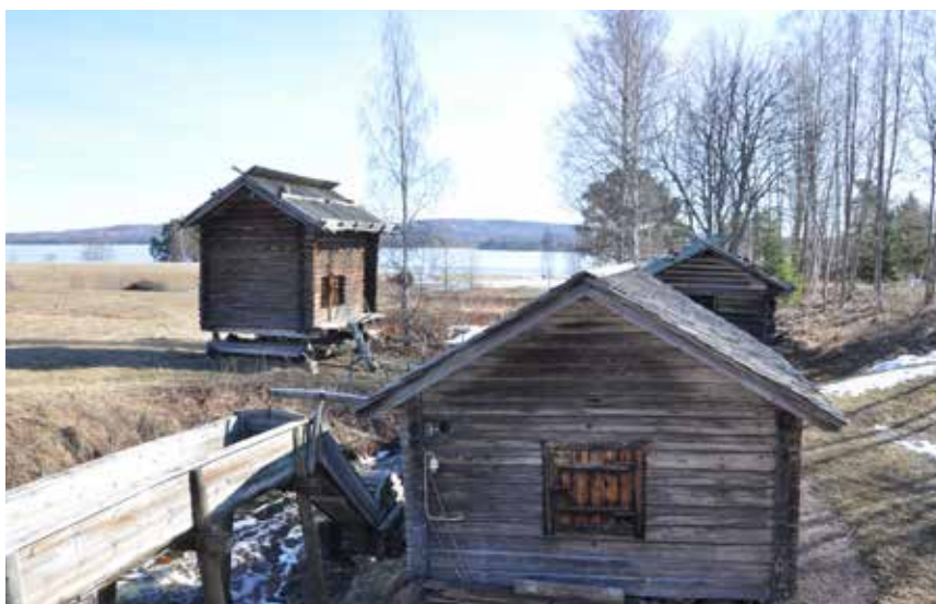
Svarstugan och härbren vid Hjulbäcksåån. I bakgrunden det öppna odlingslandskapet vid Österviken. Björken 200:1.