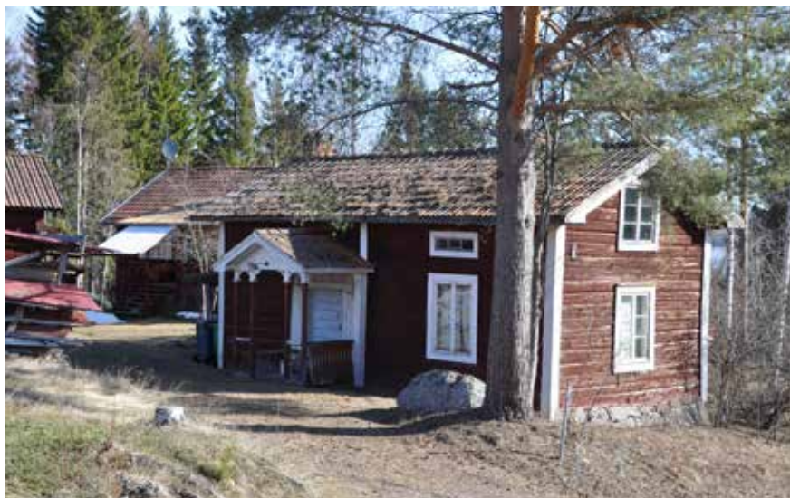
Välbevarad äldre enkelstuga i norra byklungan. Hjulbäck 169:I.